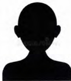
Suplente del Titular del Órgano Interno

my.sharepoint.com/:b:/g/personal/transparencia_secogem_gob_mx/EW7JY7oLkbpPp90NyBpJIpwBAWNk7aJgaZXfCDIXd2quHQ