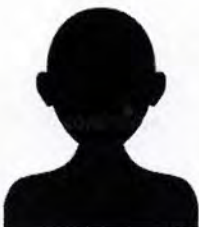
Titular del Órgano Interno

Ficha curricular: https://secogem-my.sharepoint.com/:b:/g/personal/transparencia_secogem_gob_mx/EXWp3YvfDWpKs0k89acujGsBX_QzH7gKwDxAxyw1si23nA