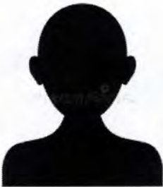
Suplente del Presidente