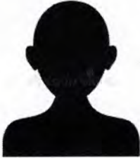
Responsable del Área Coordinadora de Archivos